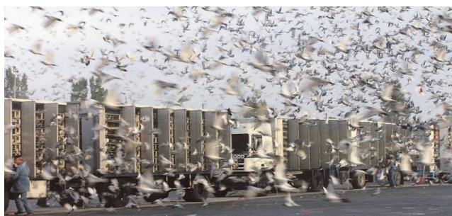
Lâcher de pigeons transportés par camion

La patronne des colombophiles sera Sainte Catherine à partir de 1949.