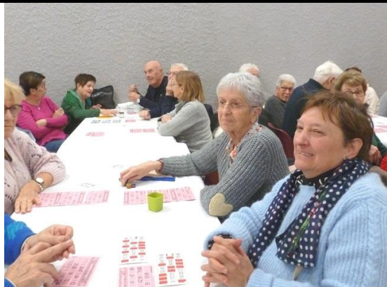
Une des nombreuses tables