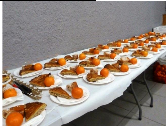
La table gourmande

90 inscrits 80 présents 77 participants pour 8 quines et 5 cartons pleins récompensés par : - des paniers de spécialités alimentaires et des colis de Noël (offerts par l'ANR) -1 Bon d'achat de 120 € -1 sortie pour 2 personnes aux Oursinades de Carry le Rouet (offert par les Transports ARNAUD).