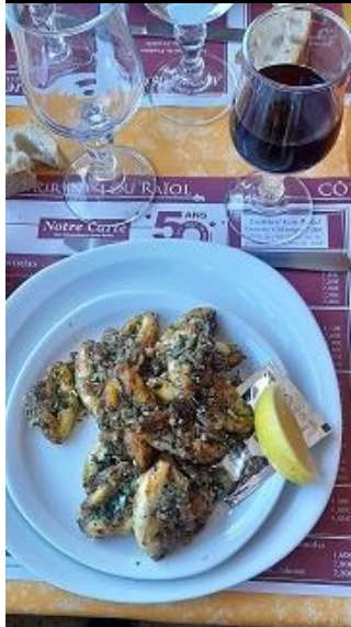
Poêlée de cuisses de grenouilles

Le journal de Décembre 2022 est paru avant que nous ayions eu le temps de relater notre sortie du 10 Novembre au col de Penedis.